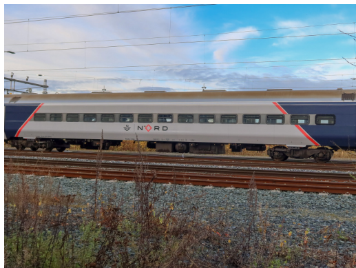
WLAB2 21094 SJ N