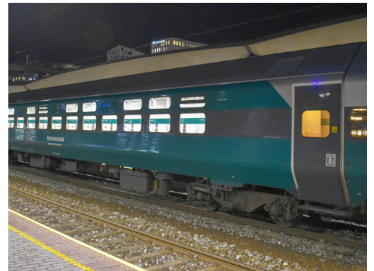
WLAB2 21093 Vy