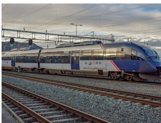
93 14 SJ N