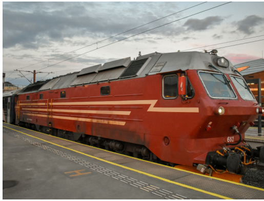
4 652 SJ N